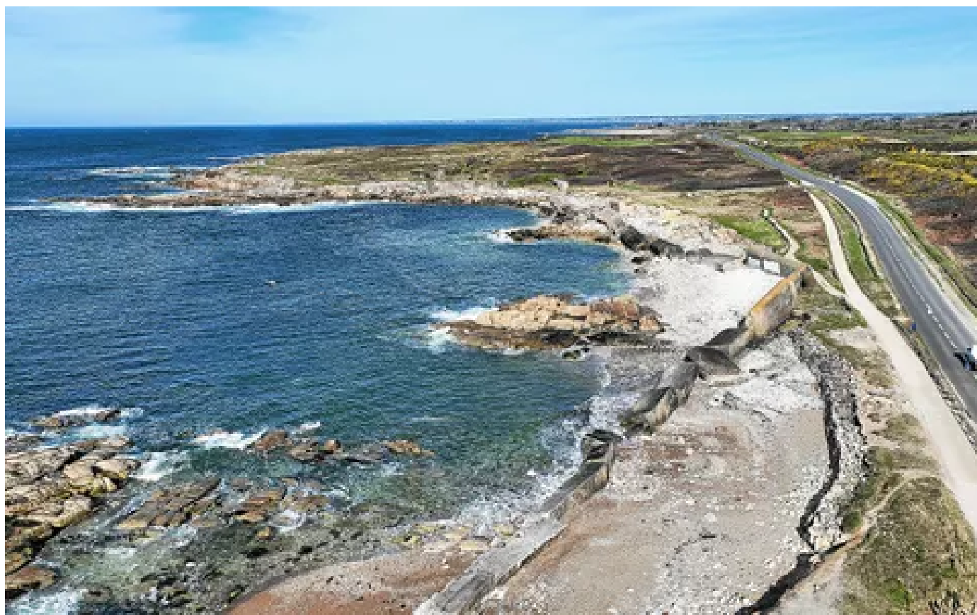
Au Courégant à Ploemeur, les vagues sont venues à bout du Mur de l'Atlantique.

tôt, la tempête Herminia laissait un impressionnant trou dans les remparts de Port-Louis. Des exemples qui montrent bien comment l'érosion se traduit concrètement sur notre territoire. En réalité, la Bretagne reste moins grignotée par la mer que d'autres régions françaises , du fait d'une prédominance de côtes rocheuses et de granit. Reste qu'en moyenne, une plage bretonne sur trois recule chaque année, comme par exemple à Guidel : la plage de la Falaise a perdu un mètre en moyenne chaque année entre 1952 et 2011.