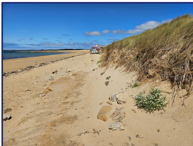
Nom fichier photo : AAAAMMJJ-m4-2