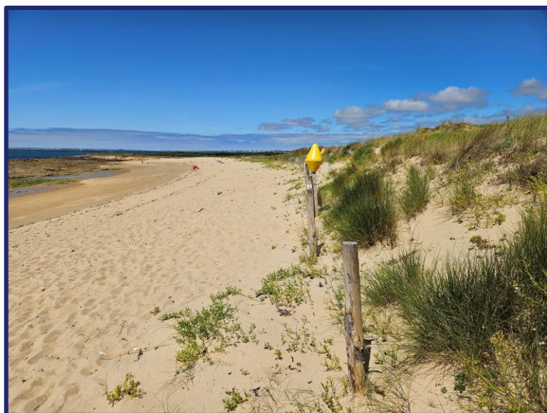
Nom fichier photo : AAAAMMJJ-m1-2