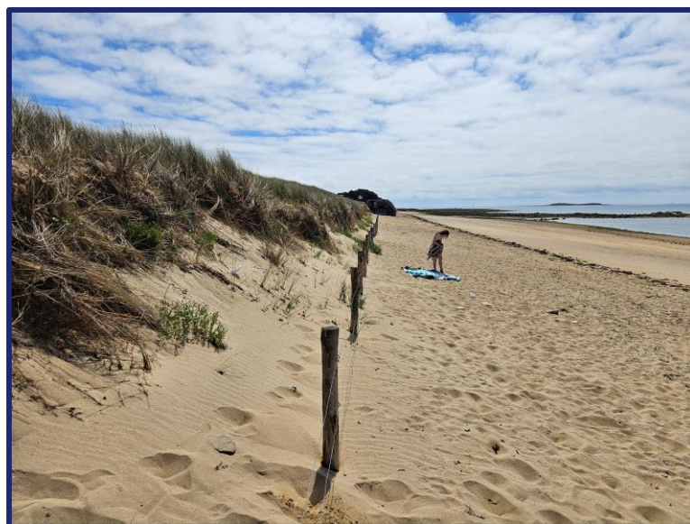
Nom fichier photo : AAAAMMJJ-m2-3