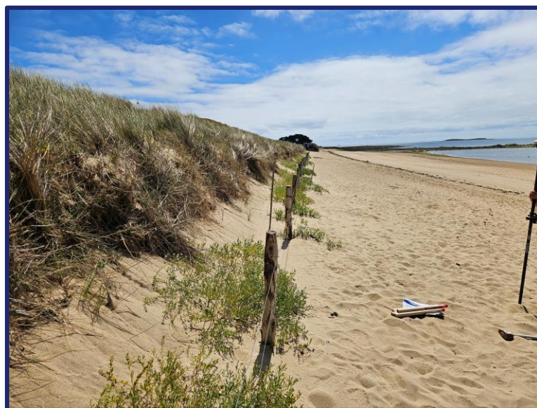
Nom fichier photo : AAAAMMJJ-m3-3