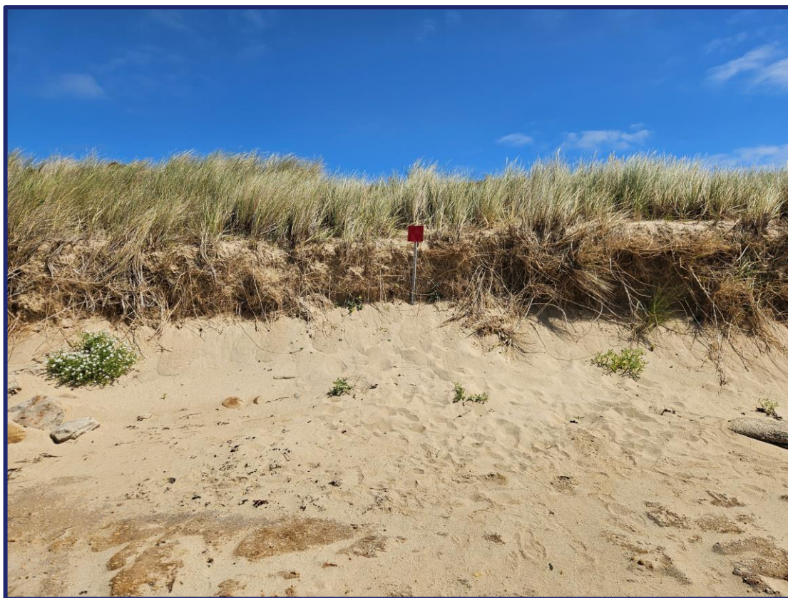
Nom fichier photo : AAAAMMJJ-m4

La quatrième mission sur la plage de St Pierre consiste à réaliser un suivi photographique du Sud-Est de la plage. Pour cela, placez-vous au niveau de la perche de la photo ci-dessous et reculez de quelques pas pour prendre une photo de face avec toujours la perche placée au milieu de l'image. Ensuite rapprochez vous à la perche, tournez vous vers l'Ouest puis vers l'Est en prenant une photo à chaque fois. Toutes les photos doivent être au format paysage. Ensuite, notez la valeur de la hauteur du sable au niveau de la perche. Inscrivez cette mesure sur votre fiche de terrain.