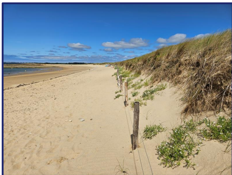
Nom fichier photo : AAAAMMJJ-m2-2