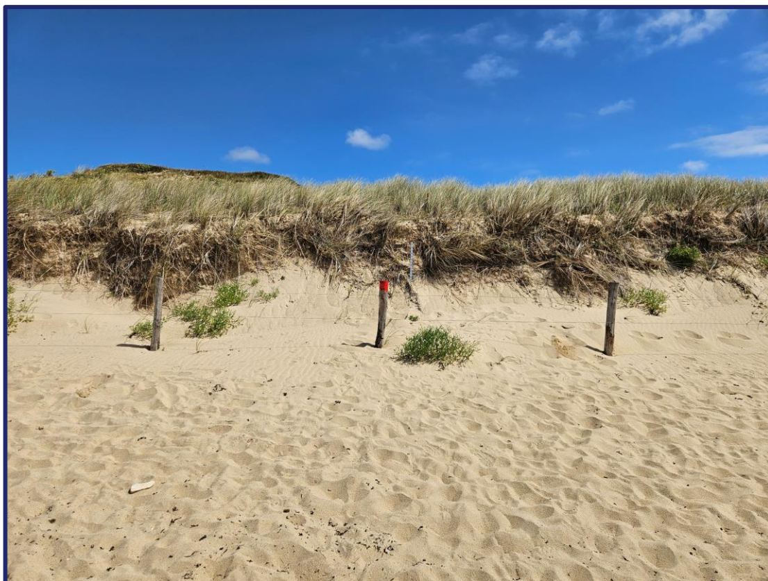
Nom fichier photo : AAAAMMJJ-m2

La seconde mission sur la plage de St Pierre consiste à réaliser un suivi photographique du centre Ouest de la plage. Pour cela, placez-vous au niveau du poteau de la photo ci-dessous et reculez de quelques pas pour prendre une photo de face avec toujours le poteau placé au milieu de l'image. Ensuite rapprochez vous au poteau, tournez vous vers l'Ouest puis vers l'Est en prenant une photo à chaque fois. Toutes les photos doivent être au format paysage. Ensuite, mesurez la hauteur du poteau à partir de la limite du sable au pied du poteau jusqu'au haut de celui-ci puis notez celle de la perche. Inscrivez cette mesure sur votre fiche de terrain.