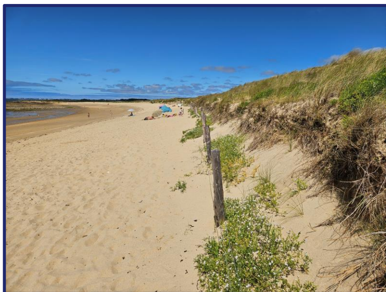
Nom fichier photo : AAAAMMJJ-m3-2