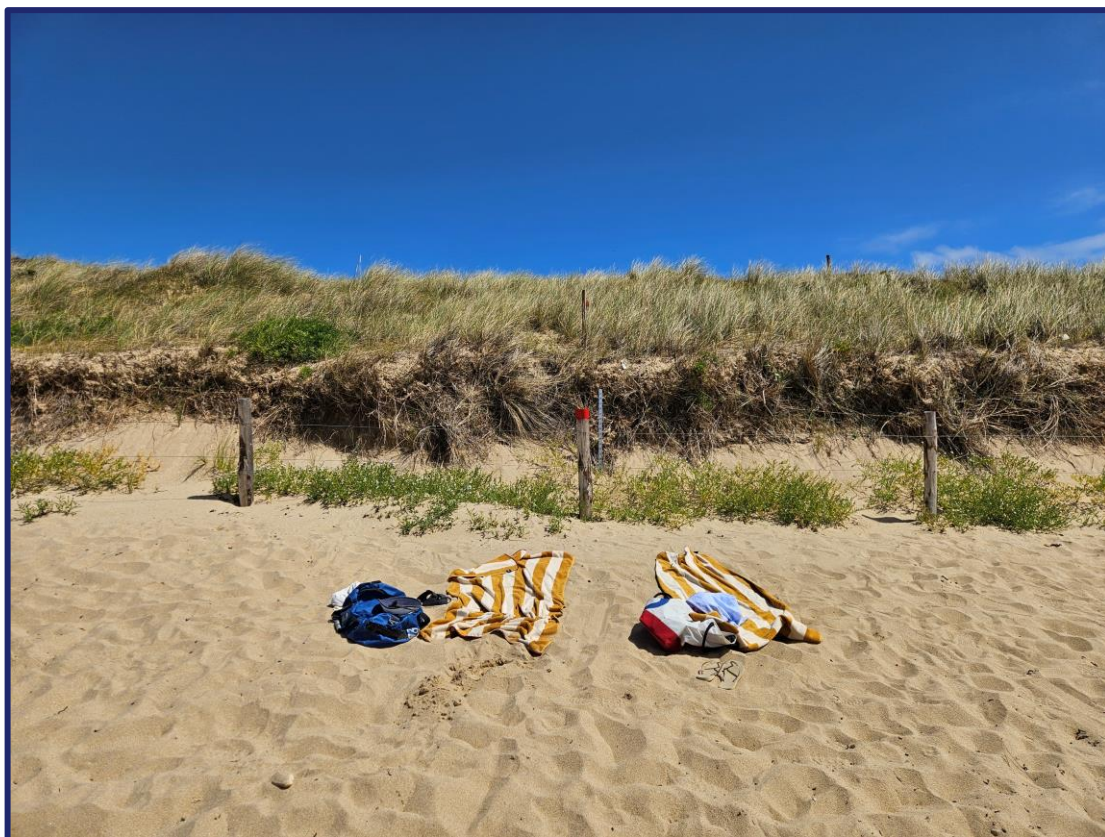
Nom fichier photo : AAAAMMJJ-m3

La troisième mission sur la plage de St Pierre consiste à réaliser un suivi photographique du centre Ouest de la plage. Pour cela, placez-vous au niveau du poteau de la photo ci-dessous et reculez de quelques pas pour prendre une photo de face avec toujours le poteau placé au milieu de l'image. Ensuite rapprochez vous au poteau, tournez vous vers l'Ouest puis vers l'Est en prenant une photo à chaque fois. Toutes les photos doivent être au format paysage. Ensuite, mesurez la hauteur du poteau à partir de la limite du sable au pied du poteau jusqu'au haut de celui-ci puis notez celle de la perche. Inscrivez cette mesure sur votre fiche de terrain.