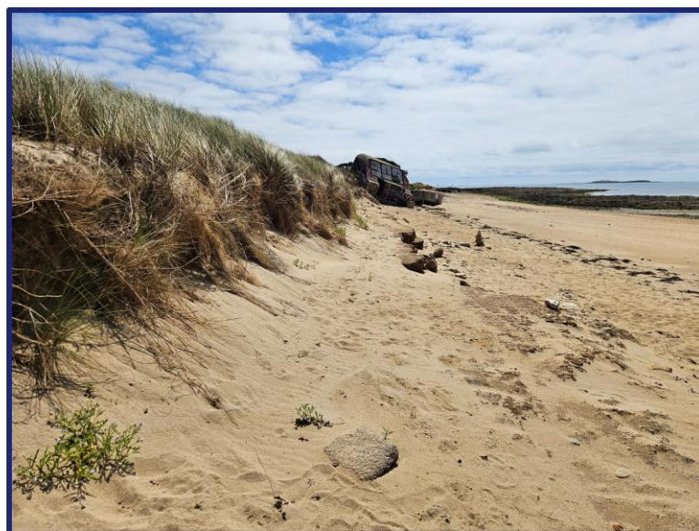
Nom fichier photo : AAAAMMJJ-m4-3