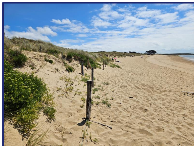
Nom fichier photo : AAAAMMJJ-m1-3