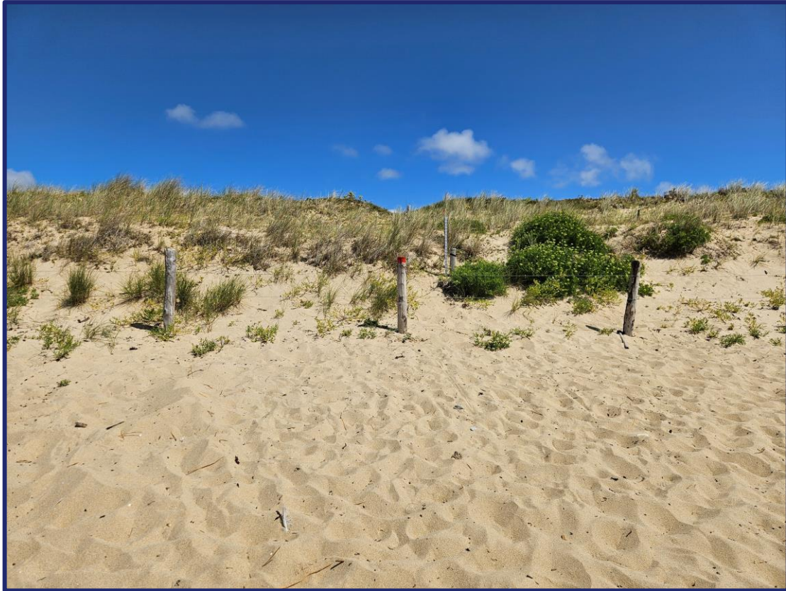
Nom fichier photo : AAAAMMJJ-m1

La première mission sur la plage de St Pierre consiste à réaliser un suivi photographique du Nord Ouest de la plage. Pour cela, placez-vous au niveau du poteau de la photo ci-dessous et reculez de quelques pas pour prendre une photo de face avec toujours le poteau placé au milieu de l'image. Ensuite rapprochez vous au poteau, tournez vous vers l'Ouest puis vers l'Est en prenant une photo à chaque fois. Toutes les photos doivent être au format paysage. Ensuite, mesurez la hauteur du poteau à partir de la limite du sable au pied du poteau jusqu'au haut de celui-ci puis notez celle de la perche. Inscrivez cette mesure sur votre fiche de terrain.